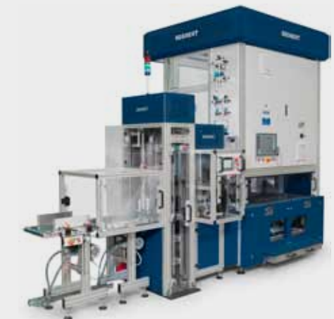
MPA-VV5 für vollautomatisches poststroutensortiertes Palettieren. MPA-VV5 for fully automatic ZIP code palletizing